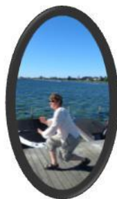
Tai chi på badebroen